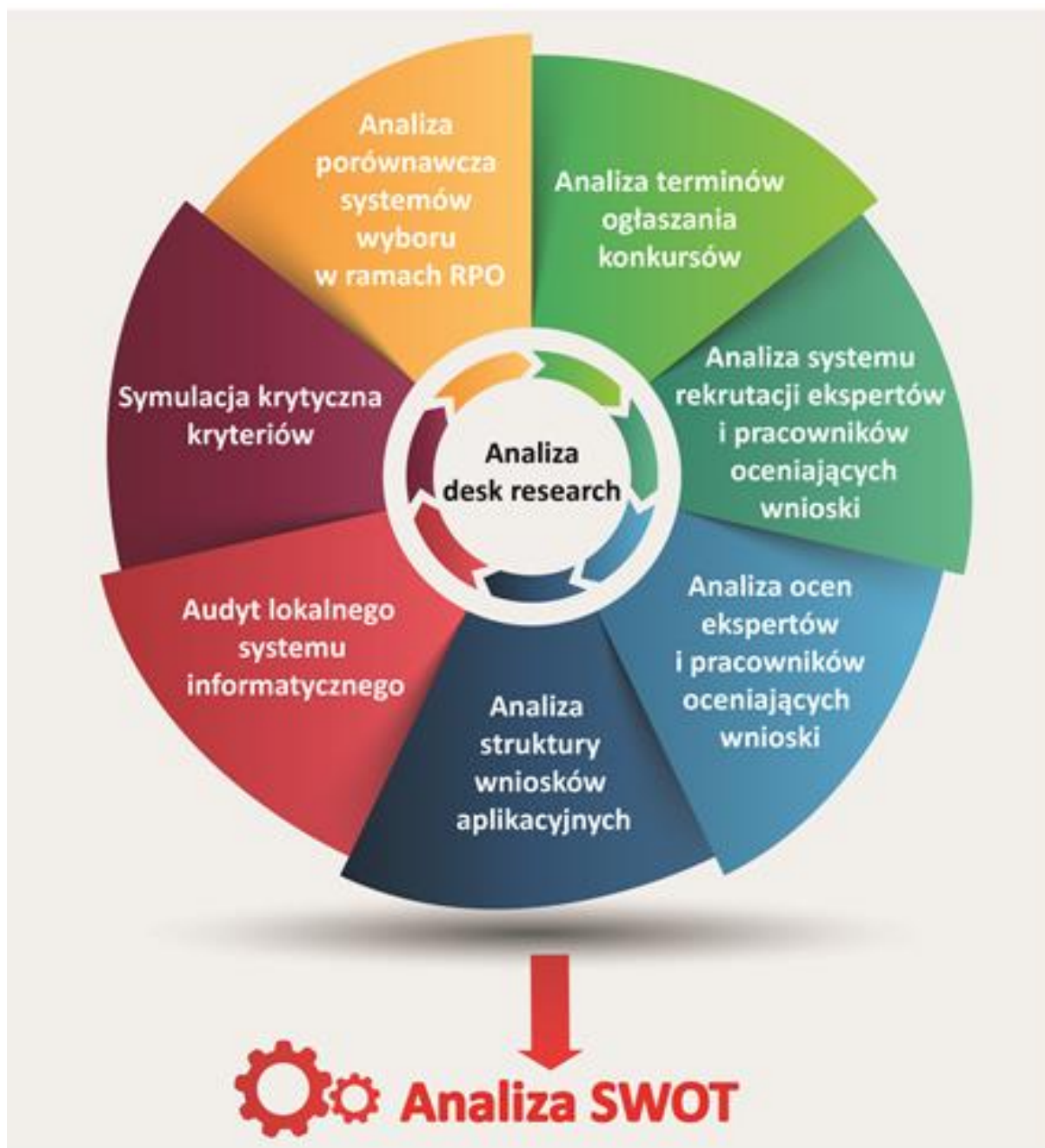
Schemat 1. Proces przeprowadzenia analizy desk research

Poniższy schemat ilustruje planowany proces przeprowadzenia analizy desk research.